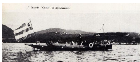
Il battello "Cusio" in navigazione.

anche alcune corse aggiuntive verso Omegna oltre a crociere serali e notturne in periodo estivo e si punterà quindi a uno sviluppo non solo del trasporto pubblico locale ma anche di servizi turistici.