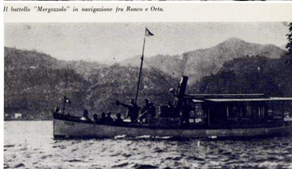
Il battello "Mergozzolo" in navigazione fra Ronco e Orta.