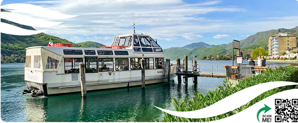
TABELLA ORARI 2022 TIMETABLE

SERVIZIO DI LINEA PUBLIC TRANSPORT SERVICE